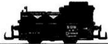
TM 34 SOB